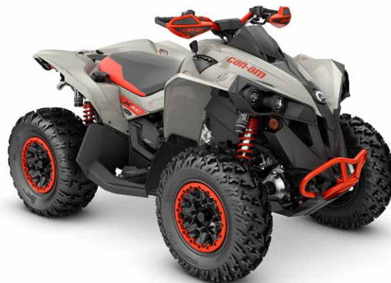
Chalk Gray & Magma Red