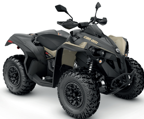
Desert Tan & Carbon Black